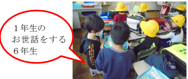
1年生のお世話をする6年生

「スタートカリキュラム」の一例として、靴箱に靴を揃えて入れる指導を、教師でなく最上級生である6年生が朝の時間を使って行いました。教師からの指導よりも身近な子供同士の学び合い・教え合いの方が効果的であると考え実践しました。6年生にとっても、下級生を思いやる優しい心が育まれ、人権尊重の精神の向上にもつながると考えています。また、4月当初、1年生は、授業を45分で区切らず、15分・30分など、モジュールで学習を行うなどの工夫をし、幼稚園・保育園生活との段差を減らし滑らかな接続を心掛けました。これからの1年生の成長が楽しみです。